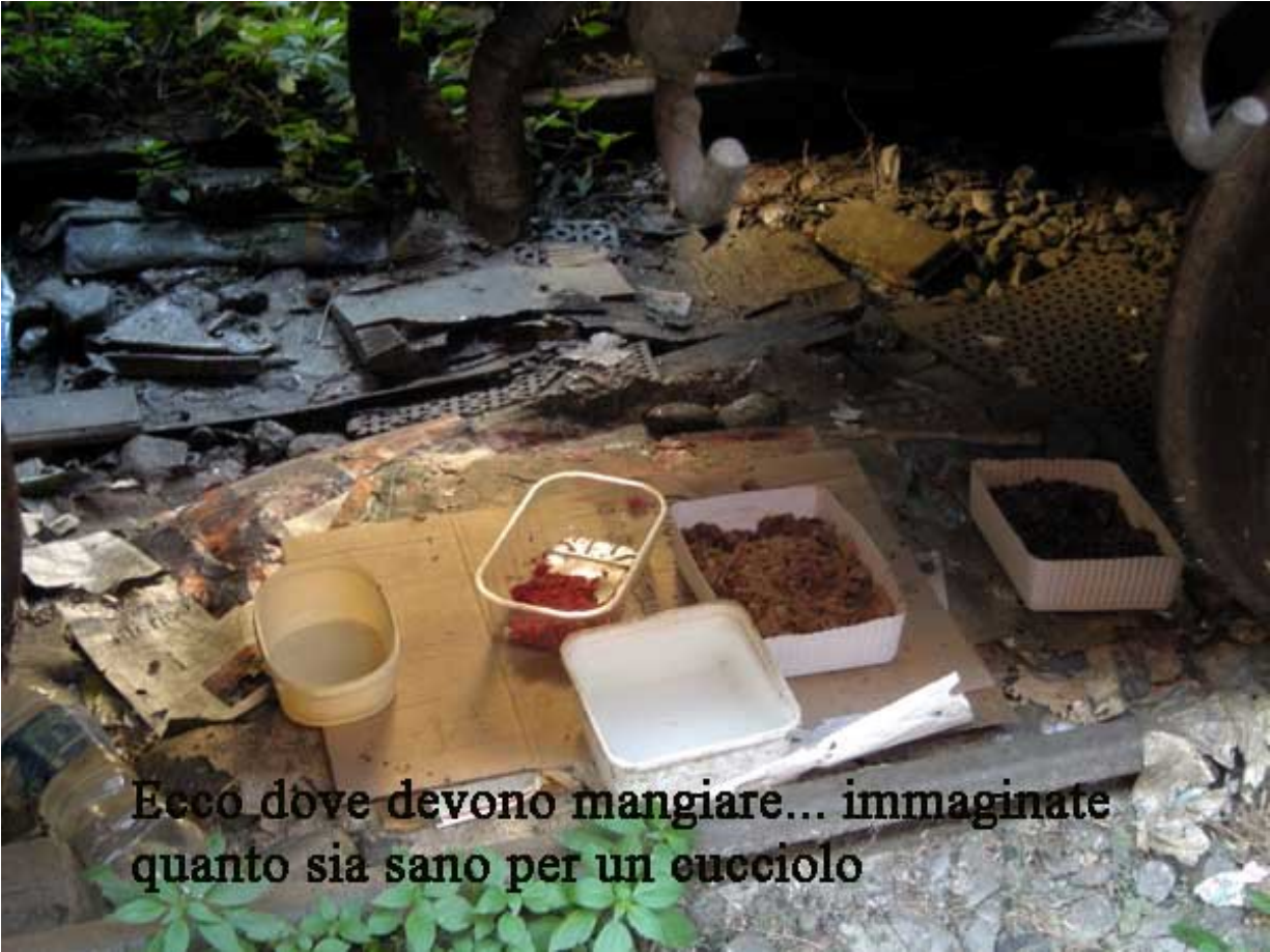
Ecco dove devono mangiare... immaginate quanto sia sano per un cucciolo