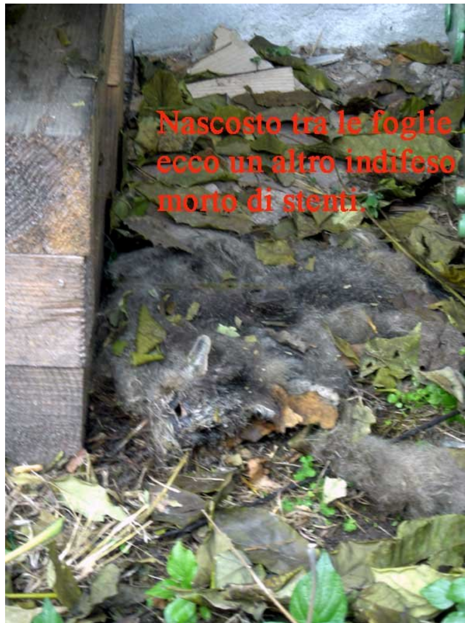
Nascosto tra le foglie ecco un altro indifeso morto di stenti.